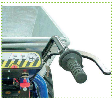
Dettaglio manubrio con paramani