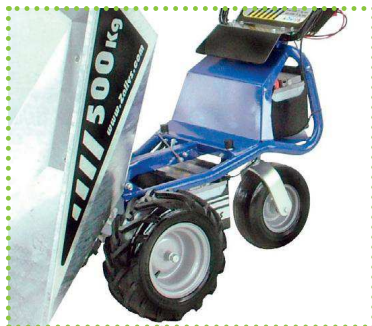
Sistema sgancio vasca