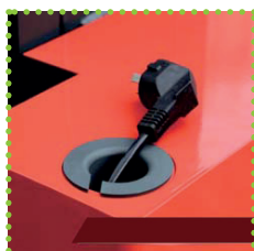
Raddrizzatore a bordo