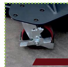
Ruote pivotanti con freno