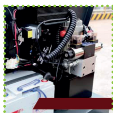
Facile accesso per manutenzione