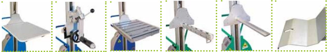
P - Pianale