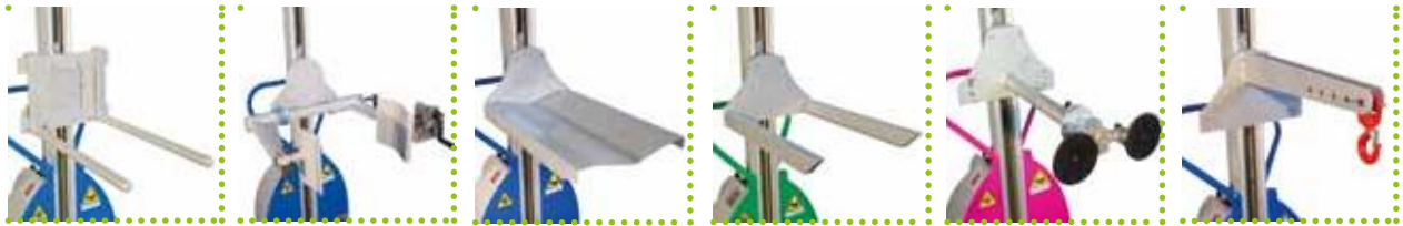
DS - Doppio sperone