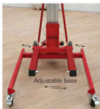
Larghezza delle razze regolabile