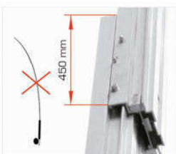
Montante a doppio sfilo con sormonto maggiorato, evita l'effetto "canna da pesca"