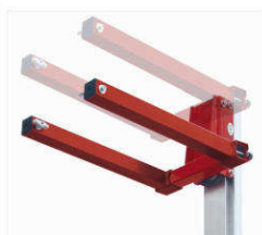
Gruppo forche installabile verso l'alto