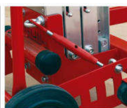
Sistema bloccaggio montante regolabile per trasporto in posizione orizzontale