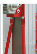
Rinforzi per una migliore stabilità