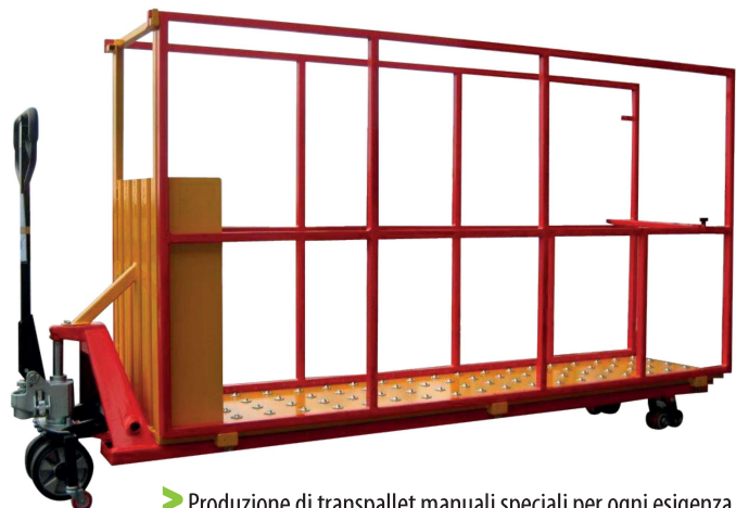
▶ Produzione di transpallet manuali speciali per ogni esigenza