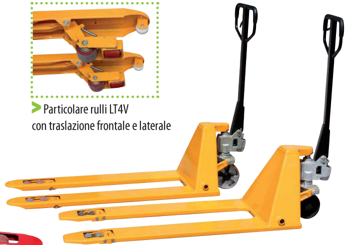
▶ Transpallet manuali ribassati a 51 o 35 mm