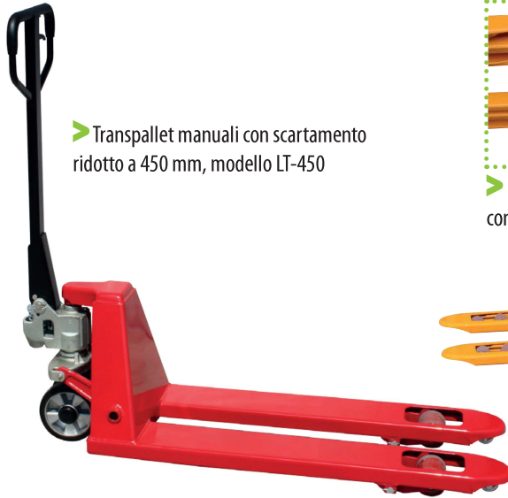
▶ Transpallet manuali con scartamento ridotto a 450 mm, modello LT-450