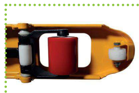
Disponibile con rulli in poly, nylon o stellana