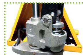
Pompa monoblocco zincata con protezione molla, serbatoio interno e ingrassatori