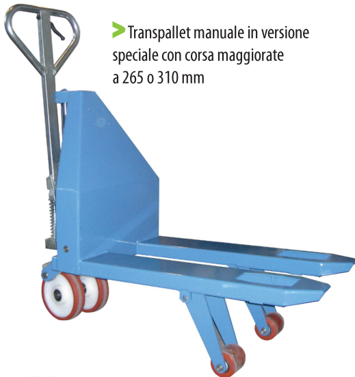
▶ Transpallet manuale in versione speciale con corsa maggiorata a 265 o 310 mm