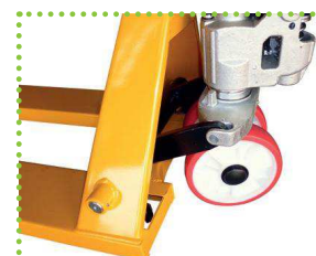
Disponibile con ruote in gomma, poly, nylon o stellana