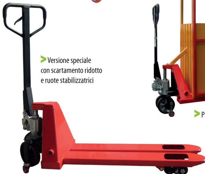
▶ Versione speciale con scartamento ridotto e ruote stabilizzatrici