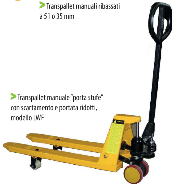
▶ Transpallet manuale "porta stufe" con scartamento e portata ridotti, modello LWF